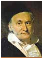
C. F. GAUSS