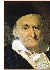
C. F. GAUSS